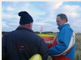
video 1: 2 min 19 sec

Alle opnames zijn van december 2005. Naast de 'lange' .AVI versies zijn ook de .WMV versies beschikbaar (deze zijn kleiner in omvang met nauwelijks kwaliteitsverlies) Via rechtermuisknop op je eigen harde schijf opslaan en dan bekijken.