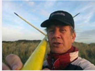
video 3: 1 min 49 sec