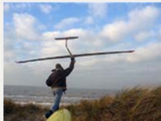
video 2: 1 min 48 sec