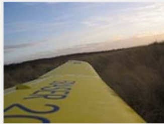
video 4: 1 min 43 sec