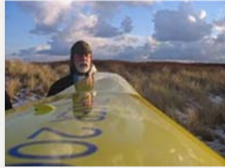
video 5: 3 minuten